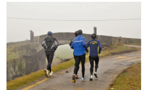
Cascina Conca ed il Ponte Gobbo

Situato al limite estremo dell'alto pavese (22 Km. da Pavia e 25 Km. da Milano), questo paese vanta antiche origini che risalgono al periodo delle guerre signorili e comunali. La nascita di Casorate viene fatta risalire al 997, anche se fino al V-VI secolo non si hanno conferme scritte del villaggio. L'undici novembre del 1356 avvenne il sanguinoso scontro fra le truppe milanesi a capo di Barnabò Visconti e la Lega Imperiale tedesca di Carlo IV con la vittoria dei primi. La famosa Battaglia di Casorate. Col passare degli anni molti furono i mutamenti di questo paese. Nel 1757 Casorate fu