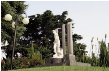
Monumento "Martiri della Liberazione"