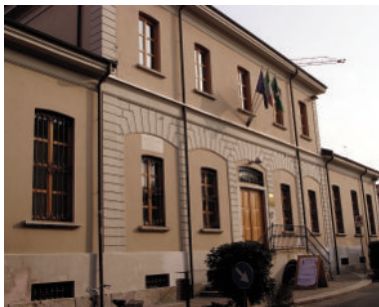
Palazzo del Comune