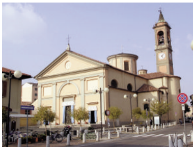
Parrocchiale di San Vittore