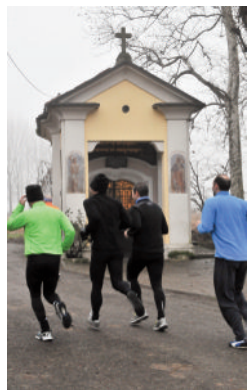
Cappella del Lazzaretto di Casorate Primo

Per l'80% la manifestazione si svolge su strade sterrate. Il percorso si snoda a cavallo fra la provincia di Pavia e quella di Milano. I temi predominanti degli itinerari sono i campi, i boschi ed il digradare del terreno verso il Ticino.