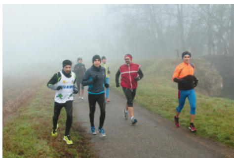
Rogge e fossi della Valle del Ticino

Proseguendo, il percorso s'inoltra nel Parco Lombardo della Valle del Ticino, con le sue rogge e