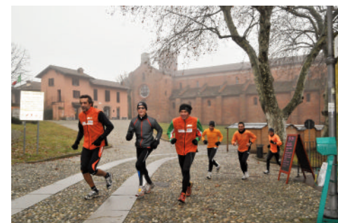
Abbazia di Morimondo

corso dei secoli. L'ultimo ampliamento, con la costruzione d'una nuova abside, risale agli anni '40 del '900.