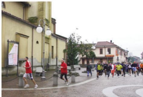
Parrocchiale di Bubbiano e Municipio

Non mancano i monumenti, con punte di fascino nella storica Cappella del Lazzaretto a Casorate Primo e nell'importante, imponente e suggestiva Abbazia di Morimondo. Dopo circa un chilometro dalla partenza, il percor-