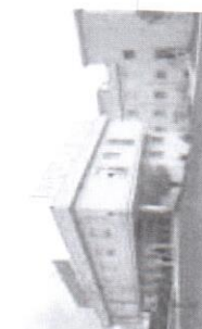
ISTITUTO CLINICO UNIVERSITARIO DI VERANO BRIANZA