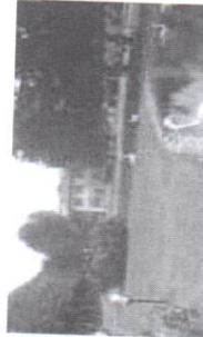
POLICLINICO DI MONZA

Considerata l'importanza di tale specialità il Policlinico di Monza ha voluto applicare un listino caratterizzato da tariffe ridotte per tutte le prestazioni che afferiscono alla medicina dello sport per le società sportive convenzionate.